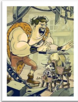
Klötzli by Blackyard